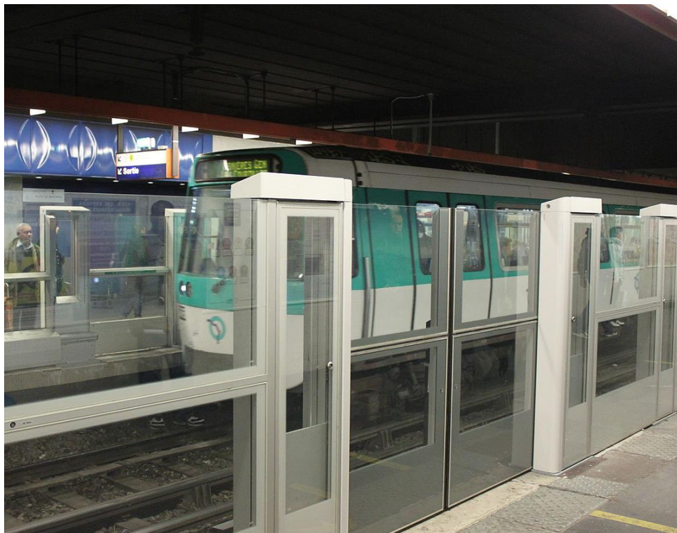
Zábrana oddělující nástupiště od kolejiště v Paříži - Wikipédia

Zdá se, že definitivním řešením by mělo být oddělení nástupiště od kolejiště stěnou či zábranou, která se bude otvírat jen v okamžiku přistavení soupravy a v místech, kde budou dveře do soupravy. Toto řešení je plánováno na nové trase D, sama její výstavba jistě potrvá dlouho a podobné opatření na stávajících trasách je v dohledné budoucnosti nereálné.