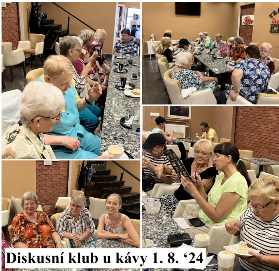
Diskusní klub u kávy 1. 8. '24

V polovině června proběhl týdenní pobyt pro nevidomé v Turčianských Teplicích s výlety do Bojnice a Kremnice. Na konci června jsme v prostorách fary Českobratrské církve evangelické společně přivítali léto a na začátku srpna jsme se setkali u kávy v Slezské cukrárně v Novém Jičíně.